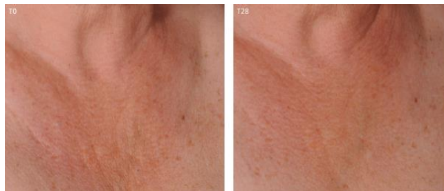
↑ 使用前(左)/使用 28 天後(右)的頸部肌膚對比圖 - 使用後皺紋淡化，肌膚平滑緊實