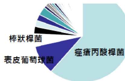
表皮三種主要菌屬