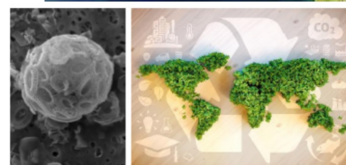
熱休克蛋白和泛素能回收損傷蛋白質